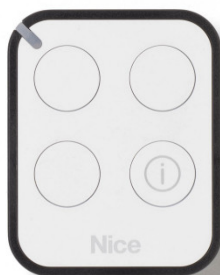
Pilot Era One BD do zarządzania automatyką wjazdową.

Piloty zdalnego sterowania komunikują się z użytkownikiem za pomocą trzech kolorów (zielony, czerwony, pomarańczowy), wibracji (Era One BD) lub sygnału dźwiękowego (Era P BD).