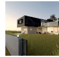
Smart Home – Nice Wi-Fi