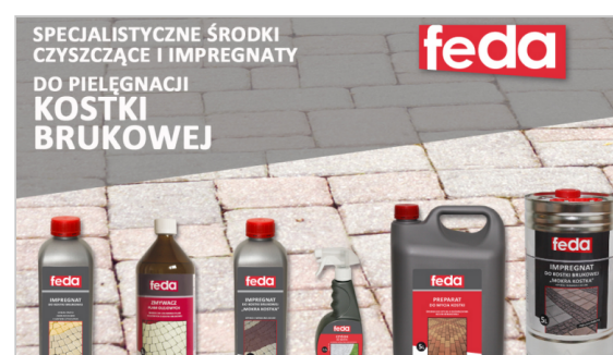
Nowe produkty w Onduline - Fedra do kostki brukowej