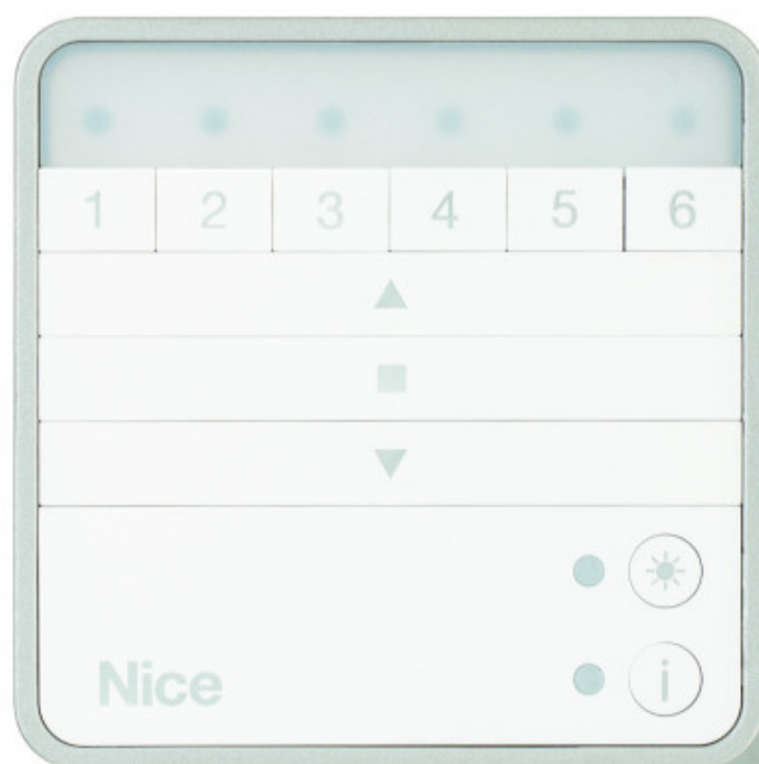
Naścienny pilot Era W BD do zarządzania roletami, markizami i żaluzjami.

Według ABI Research wartość rynku rozwiązań dla inteligentnego domu do 2022 roku sięgnie 123 mld dolarów. Rośnie też entuzjazm konsumentów - wedle badania przeprowadzonego przez Oferteo.pl, na wdrożenie Smart Home zdecydowało się 23% ankietowanych, którzy w ubiegłym roku (2018) budowali dom.