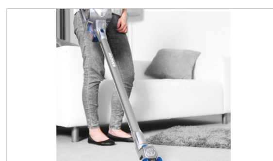
Nowość Hoover - bezprzewodowy odkurzacz H-FREE 700